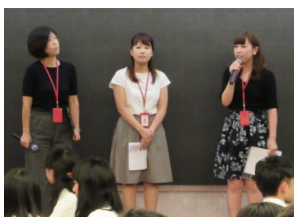
JTB シンガポール支社の職員の皆さん

現地時間の 16 時 20 分ごろ、シンガポールのチャンギ空港へ到着。現地のガイドさんと対面し、バスでレストランへ移動。食事の後、JTB シンガポール支社の職員の方々から、「海外で働くということ」をテーマに講演をしていただきました。