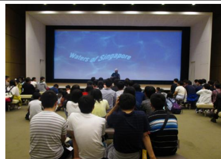
ニューウォーター・ビジター・センターで説明を聴く生徒たち