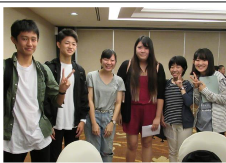
学生ガイドと共に班別行動開始