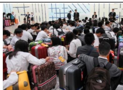
集合して説明を聞く生徒達

8 時 30 分、中部国際空港に集合。出国手続きを行い、10 時にシンガポール行きの飛行機に搭乗。いよいよ出発です。