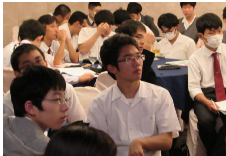
熱心に講演を聴く生徒