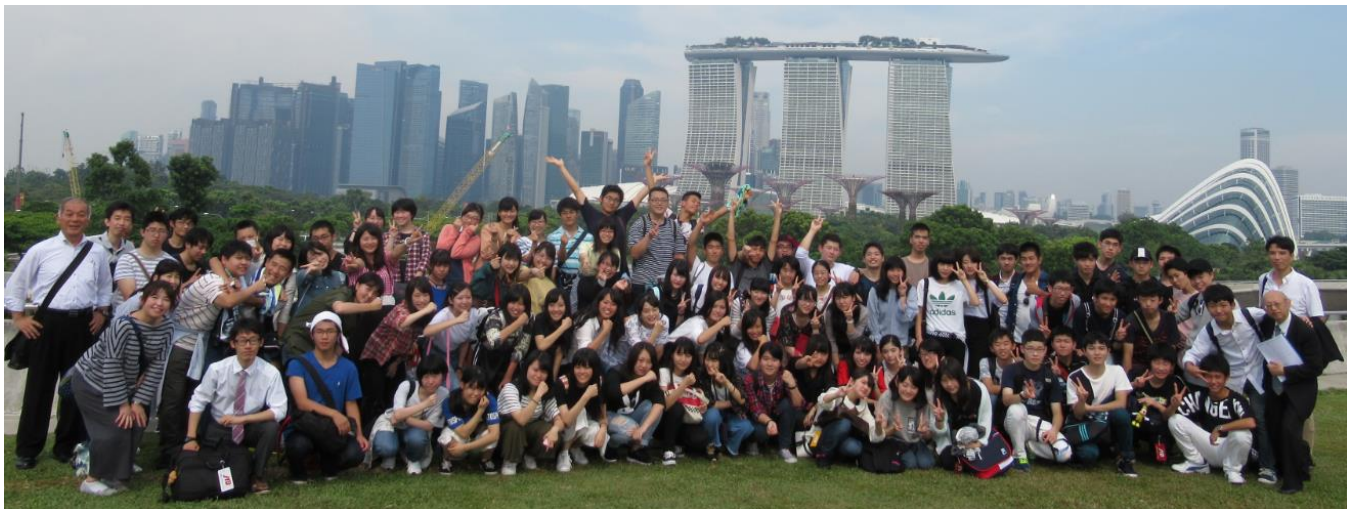
マリーナ・バレッジ公園にて記念写真

3 日目はたくさんの施設を訪問しました。最初に、マリーナ・バレッジ公園を訪問。2008 年に作られた貯水池です。そこで記念写真を撮影しました。その後は、ニューウォーター・ビジター・センターへ。水資源に乏しいシンガポールは、水の自給が大きな課題で、ニューウォーター・ビジター・センターはそれを解決するための浄水施設です。昼食を挟んで、午後はガーデンズ・バイ・ザ・ベイへ。シンガポールの大植物園です。大きなドーム状の植物園で、様々な草木に触れました。その後は、リバー・サファリへ。世界の有名河川とその周辺に生息する魚や動物を観ることができました。