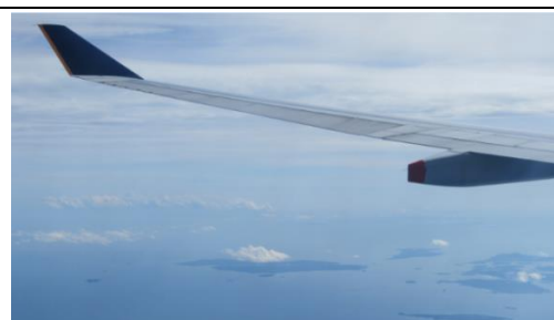
飛行機からの景色

現地時間の 16 時 20 分ごろ、シンガポールのチャンギ空港へ到着。現地のガイドさんと対面し、バスでレストランへ移動。食事の後、JTB シンガポール支社の職員の方々から、「海外で働くということ」をテーマに講演をしていただきました。