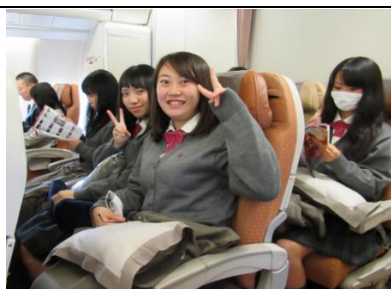
飛行機に搭乗。行ってきます！