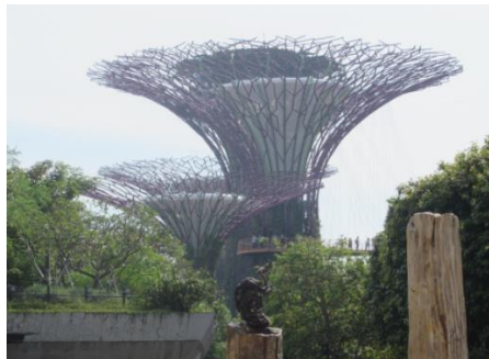
ガーデンズ・バイ・ザ・ベイ